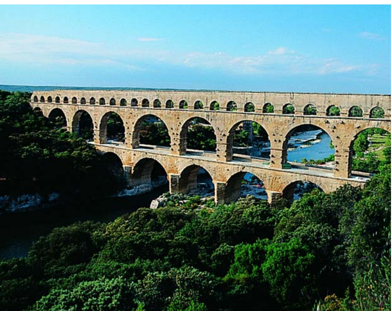
Le Pont du Gard acheminait l'eau vers la ville de Nîmes.